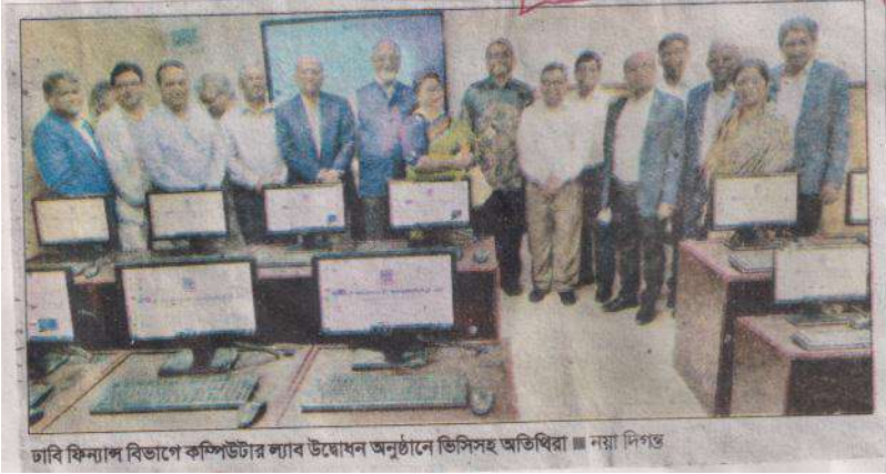
ঢাবি ফিন্যান্স বিভাগে কম্পিউটার ল্যাব উদ্বোধন অনুষ্ঠানে ডিসিসহ অতিথিরা।