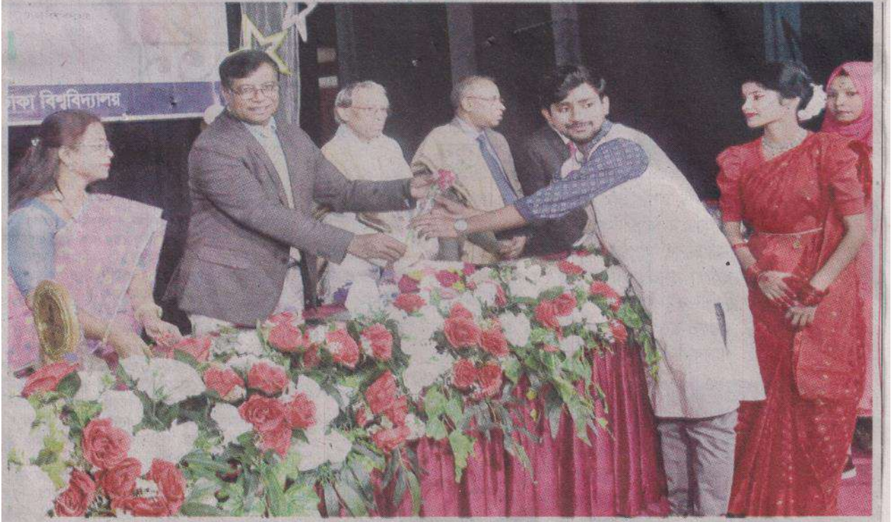
ঢাকা বিশ্ববিদ্যালয়ের পালি এন্ড বুদ্ধিস্ট স্ট্যাডিজ বিভাগের নবীনবরণ ও বিদায় সংবর্ধনা অনুষ্ঠান গত সোমবার ঢাবির ছাত্র-শিক্ষক কেন্দ্র মিলনায়তনে অনুষ্ঠিত হয় —মানবকণ্ঠ