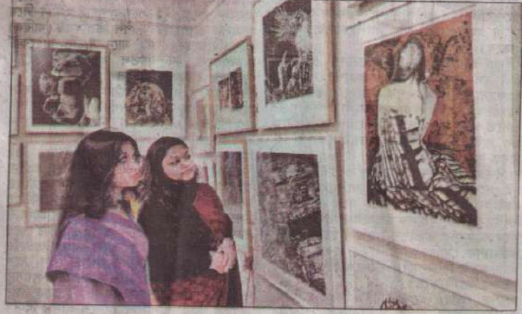
ঢাকা বিশ্ববিদ্যালয়ের চারুকলা অনুষদের জয়নুল গ্যালারিতে ছাপচিত্র বিভাগের বার্ষিক শিল্পকর্ম প্রদর্শনীর ছবি দেখছেন দর্শনাধীরা