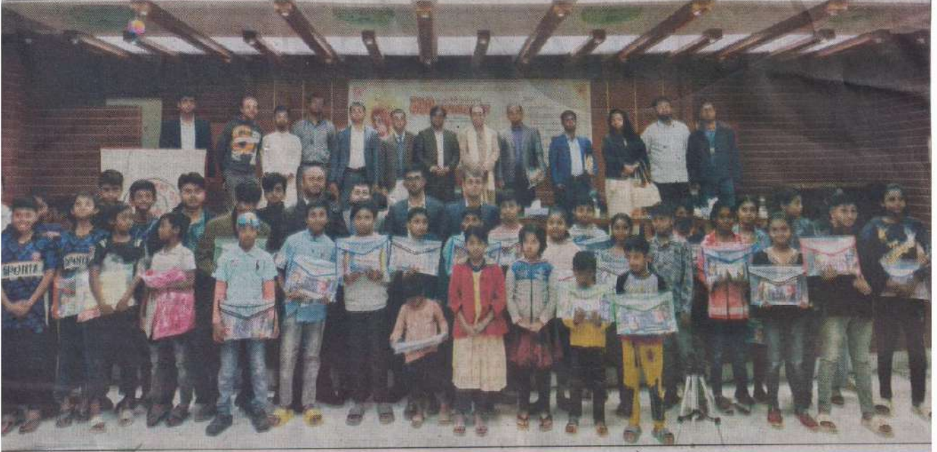
On the occasion of the 162nd birth anniversary of Swami Vivekananda, a program was held at the Rabindra Bhaban Auditorium of Jagannath Hall on Sunday.