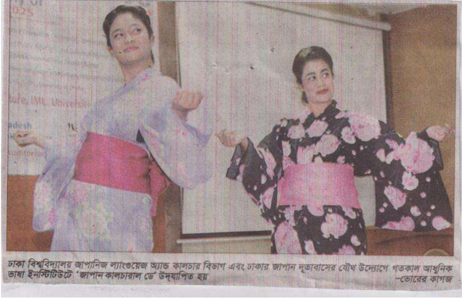
ঢাকা বিশ্ববিদ্যালয় জাপানিজ ল্যাংগুয়েজ অ্যান্ড কালচার বিভাগ এবং ঢাকার জাপান দূতাবাসের যৌথ উদ্যোগে গতকাল আধুনিক ভাষা ইনস্টিটিউটে 'জাপান কালচারাল ডে' উদযাপিত হয় -ভোরের কাগজ