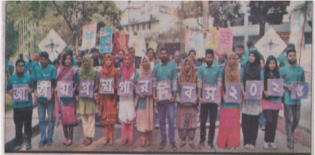
Dhaka University information science and library management department celebrates National Library Day-2025 on the campus on Wednesday.