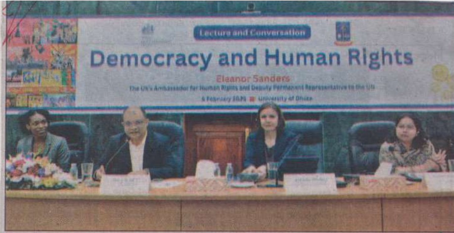
Dhaka University Applied Democracy Lab and British high commission in Dhaka jointly organise a seminar on democracy and human rights at the Nabab Nawab Ali Chowdhury Senate Building on Dhaka University campus on Wednesday. — Press release.