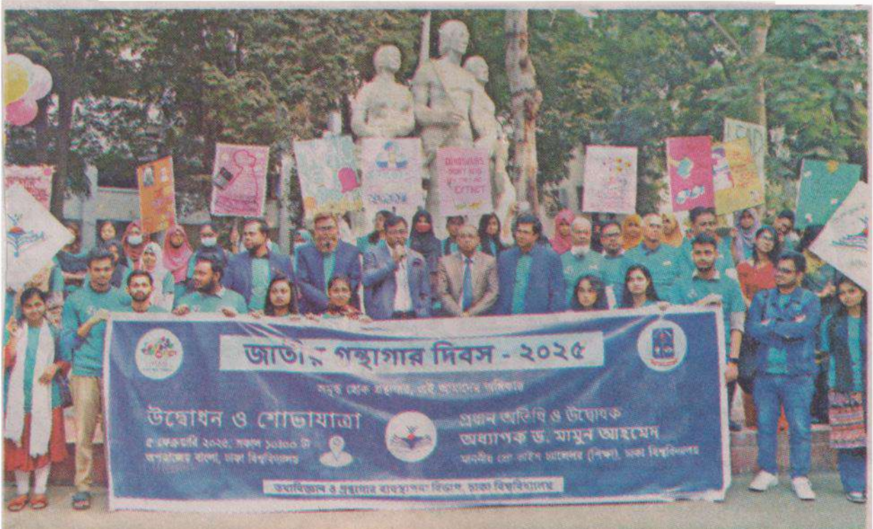
জাতীয় গনস্কাগার দিবস উপলক্ষে বৃধবার ঢাকা বিশ্ববিদ্যালয়ের তথ্যবিজ্ঞান ও গনস্কাগার ব্যবস্থাপনা বিভাগের শোভাযাত্রা