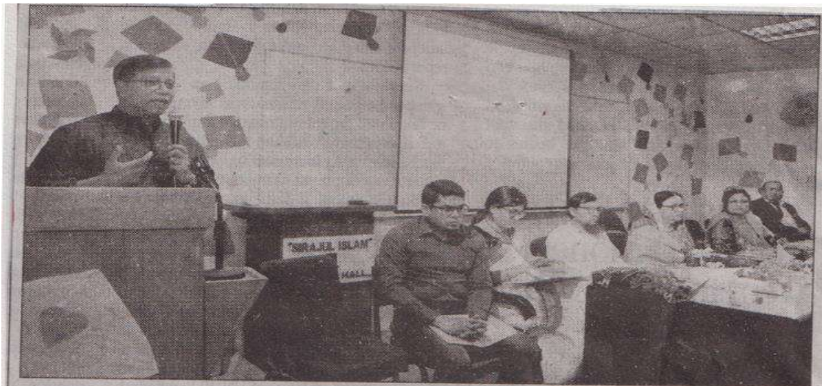
Center for Research in Multidiscipline (CRM), Dhaka University Research Society (DURS) and Center for Psychological Health (CPH) jointly organized a seminar titled 'Addressing Psychological Problems among Undergraduate and Post-graduate students after July-August movement in Bangladesh' yesterday.