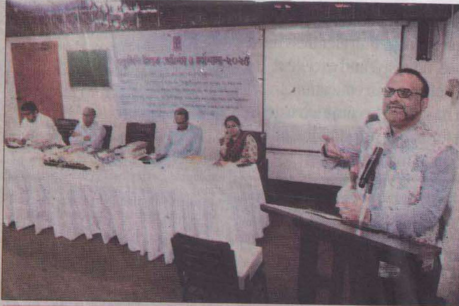
Dhaka University Launches 3-Day Manuscript Workshop to Preserve & Decipher Rare Texts, Promoting Cultural Heritage & Academic Exchange. Photo: Courtesy