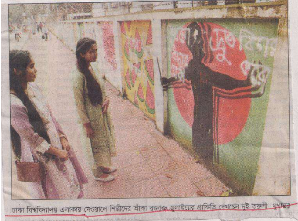
ঢাকা বিশ্ববিদ্যালয় এলাকায় দেওয়ালে শিল্পীদের আঁকা রক্তাক্ত জুলাইয়ের গ্রাফিতি দেখাছেন দুই তরুণী