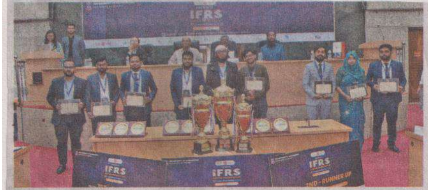
প্রতিযোগিতায় বিজয়ী শিক্ষার্থীরা