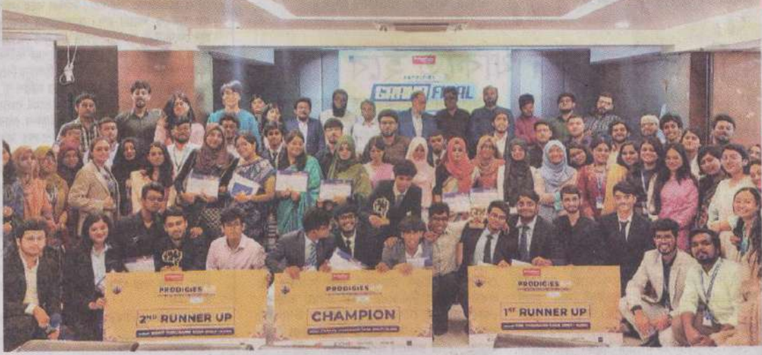
ঢাকা বিশ্ববিদ্যালয়ের ড. আব্দুল্লাহ ফারুক সম্মেলনকক্ষে গতকাল 'প্রোডিজিস ৬.০ : ক্রাফটিং সলিউশন, ফোরজিং লিডার্স' শীর্ষক বিজনেস পলিসি প্রতিযোগিতা অনুষ্ঠিত হয়।