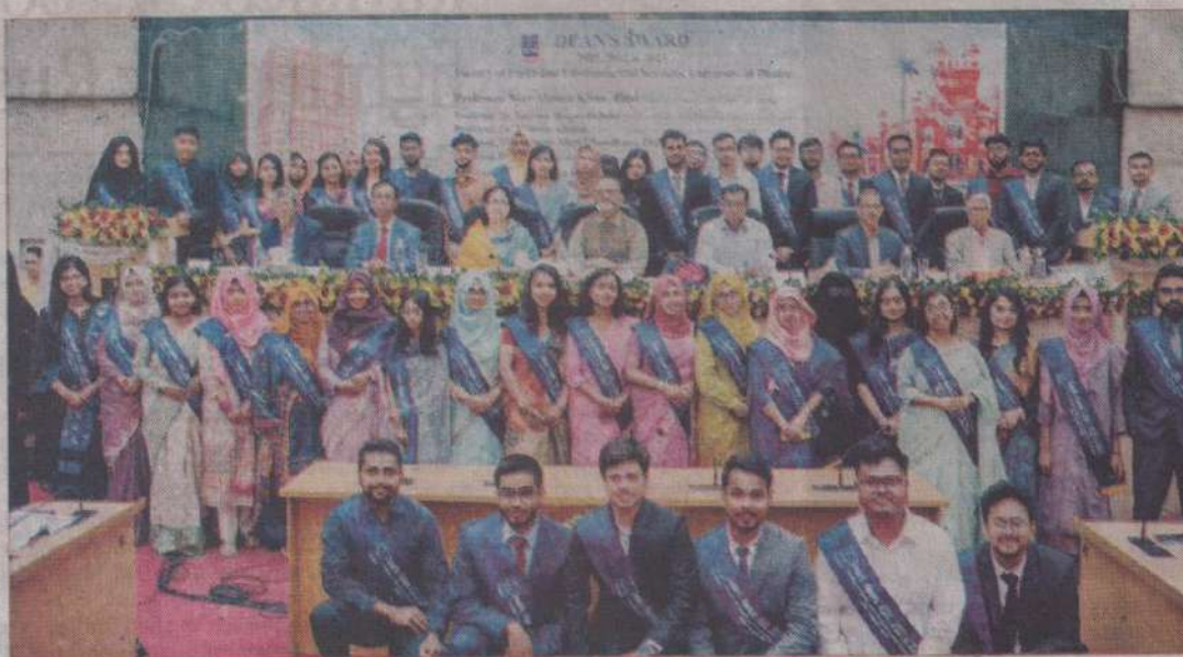
Faculty of Earth and Environmental Sciences, University of Dhaka has been awarded the Dean's Award for three years (2021, 2022, and 2023). The award-giving ceremony was held at the Nabab Nawab Ali Chowdhury Senate Building of the University.