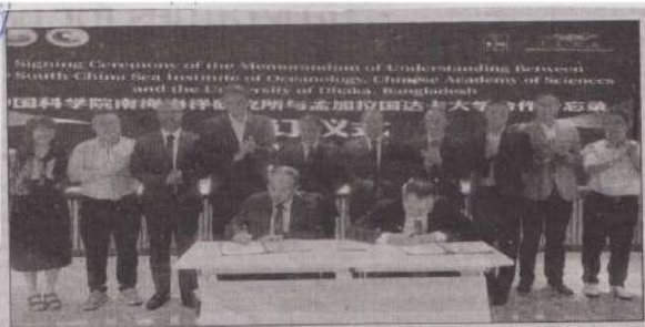
A Memorandum of Understanding (MoU) between the University of Dhaka and South China Sea Institute of Oceanology (SCSIO), Chinese Academy of Sciences was signed on Monday at Nansha Campus of SCSIO in China.