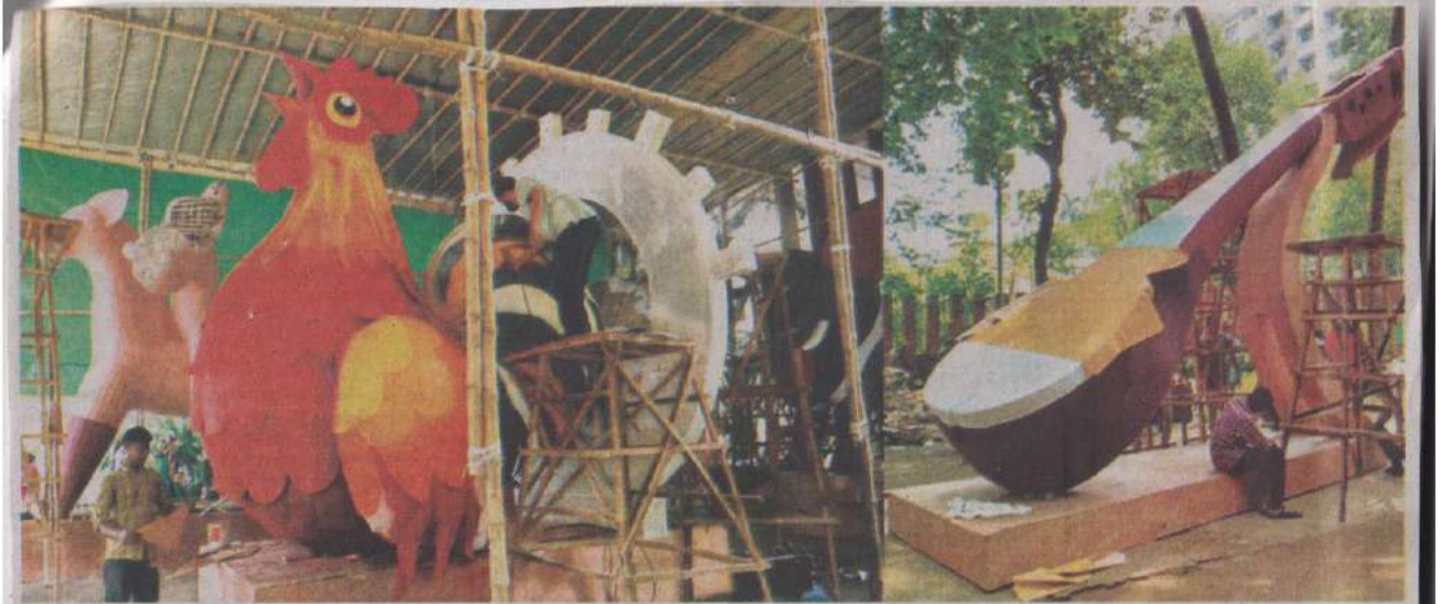
চলছে বর্ষবরণের শেষ মুহূর্তের প্রস্তুতি। ছবিটি: গতকাল ঢাকা বিশ্ববিদ্যালয়ের চারুকলা থেকে তোলা