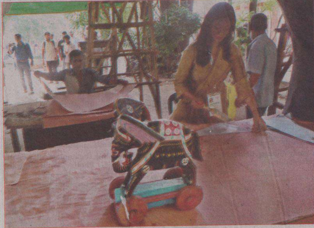
All the preparations to welcome the Bengali New Year are almost over at the Fine Arts Faculty of Dhaka University. The motifs of Rooster, Elephant, Dotara for the 'Baishakhi Procession' to celebrate the New Year are almost complete. And the horse and the pigeon are being painted. The photo was taken on Monday afternoon.

complicates prep ating orate Pahela the rection