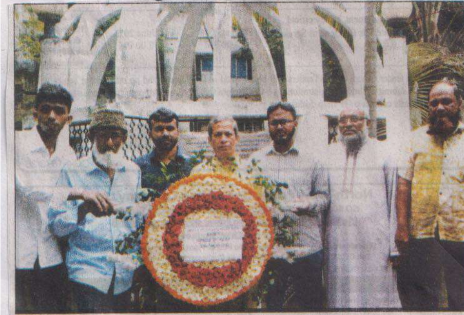
The University of Dhaka pays homage to Nawab Sir Salimullah, celebrating his 155th anniversary of birth, at his grave at Begum Bazar in the Old Dhaka on Sunday.