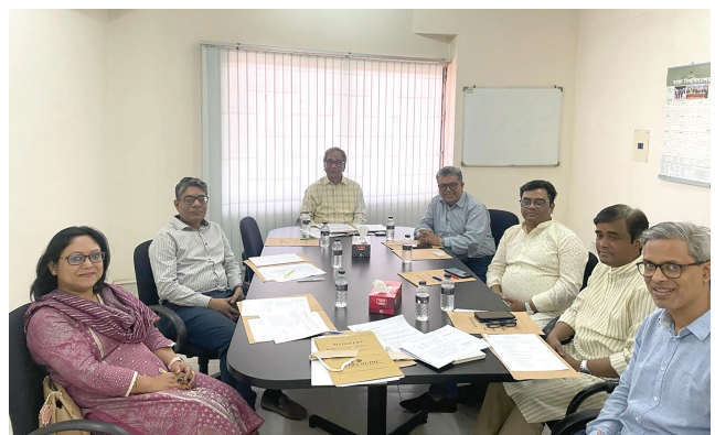
Conference Organizing Committee Meeting