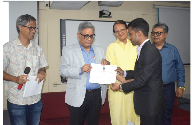
Certificate Giving Ceremony